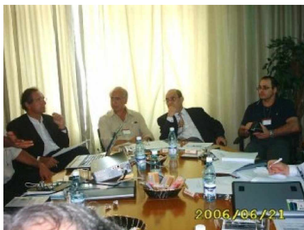
PRESIDENTE CONGRESO INTERNACIONAL DE CIRUGÍA PEDIÁTRICA