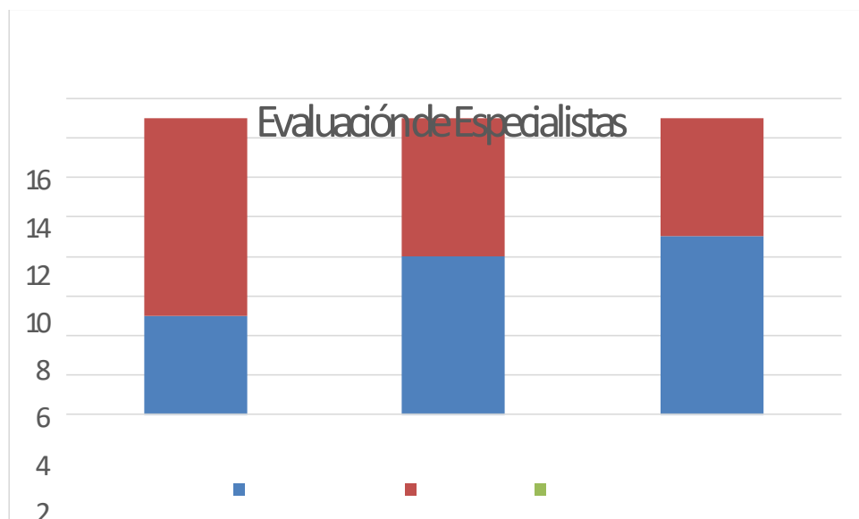
Gráfico con los resultados de la evaluación de los especialistas.

Como puede apreciarse en el gráfico no se otorgó la categoría inadecuado, por lo que la estrategia es válida según los especialistas. Además, la evaluación se realizó a través del análisis del cumplimiento de las acciones, estas se evalúan trimestralmente por el consejo de dirección y los trabajadores; anualmente se evalúa la estrategia según los rangos definidos en la tabla 2.